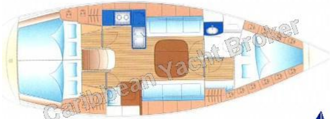
3-Kabinen Version / 3-Cabin version