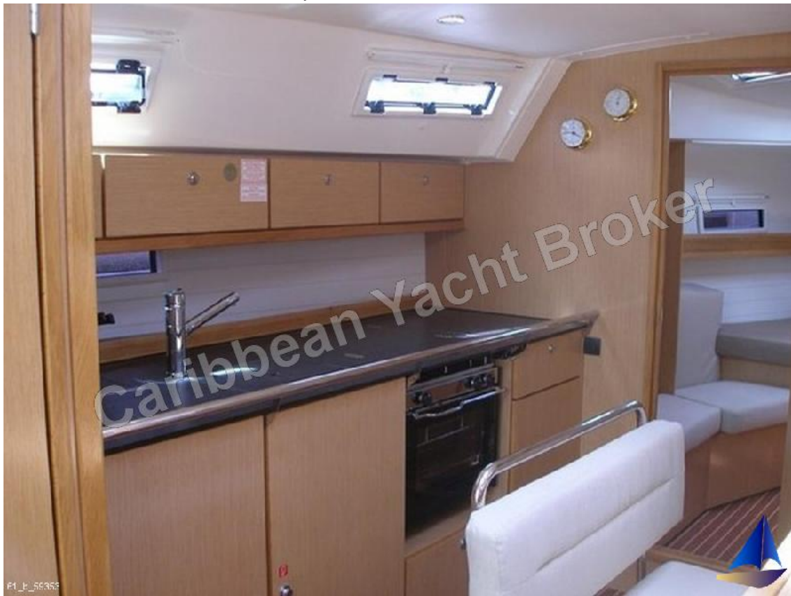
Navigation / Bavaria Cruiser 40 - 2011