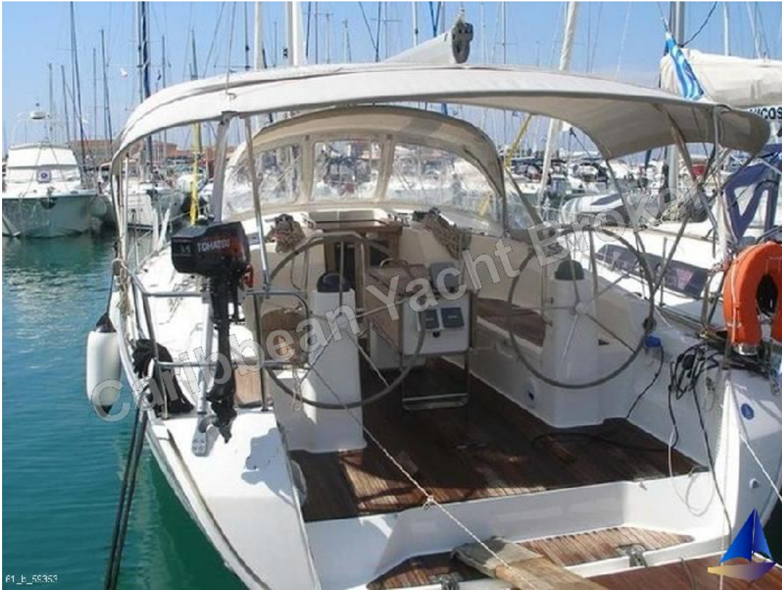
Salon / Bavaria Cruiser 40 - 2011